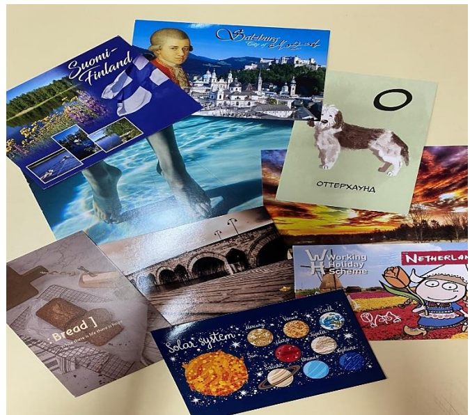
Exemplos de postais recebido expostos na Sala de Línguas da ESPAB.